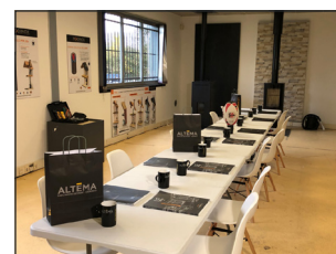
ALTEMA Saint Orens (31)