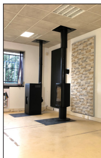
ALTEMA Saint Orens (31)