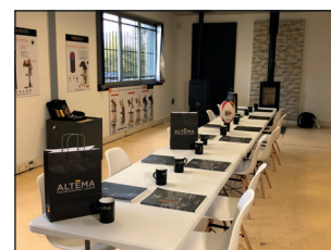
ALTEMA Saint Orens (31)