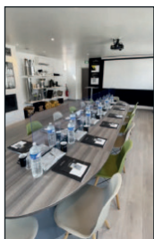
ALTEMA Carros (06)